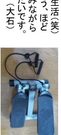
継続が大切です(笑)

新型コロナウイルスの影響で、外出を控え、運動不足になり、このままでは足の筋肉が衰えていってしまう...。何か気軽に無理なく長続き出来る運動はないかと探していたところ...見つけました!それは「ツイストステップ」です。テレビを見ながら、毎日100回(時間にすると六分ほど)を目標に、ステップ運動をすることにしました。しかも腕力(↑これは、ちよっとキツイです)まで同時に鍛えることができるのです。これが、なかなかの抵抗がかり丁度良いのです。これなら継続できそうです。今のところ、なんと二ヶ月ほど続いています。無理なく、簡単に、効果的に継続できる運動をモットーに。明るい老後生活(笑)が送れるよう、頑張ります。