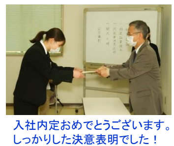
入社内定おめでとうございます。しっかりと決意表明でした!