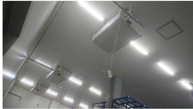
(左上) 倉庫の出入口にはシートシャッターを装備 (左下) 格納用のラックの搬入も終了しています (右上) 倉庫北側(8号線側)には定温倉庫の広告も (右下) 室内の冷房装置 たいま試験稼働中です