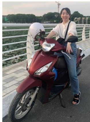
ベトナム人の友人のバイクを借りて(運転はしていませんよ)