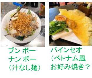
パン・ポーン・ナン・ポーン (汁なし麺)