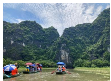
ニンビン・タムコック