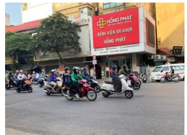
ベトナムはバイクだらけです